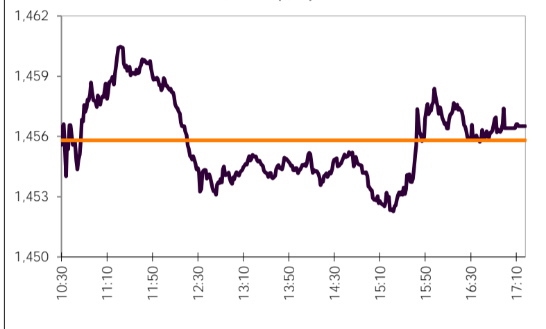
Γενικός Δείκτης Τιμών Χ.Α.