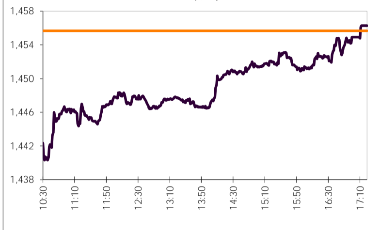
Γενικός Δείκτης Τιμών Χ.Α.