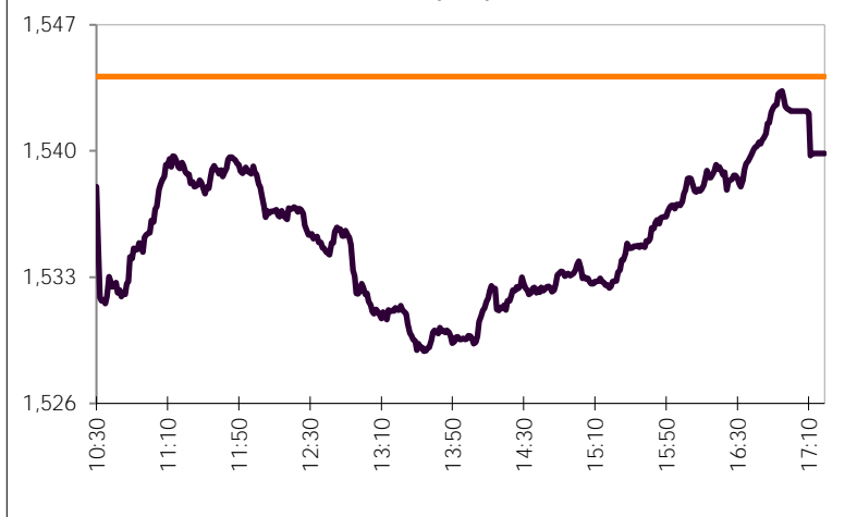
ΤΙΜΕΣ FIXING ΝΟΜΙΣΜΑΤΩΝ