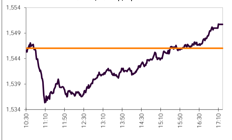
ΤΙΜΕΣ FIXING ΝΟΜΙΣΜΑΤΩΝ